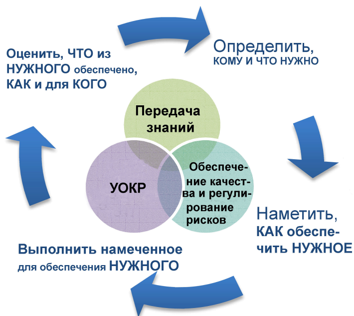
Диаграмма 3. Проектный цикл основной деятельности и ТС

8. В ходе РАП "искомые" процедуры и рекомендации отрабатывались с учетом информационных потребностей, возможных вариантов проведения мероприятий, факторов риска, соображений, высказанных отделениями на местах, соответствующего распределения функций и анализа недостающих элементов. Ее конечным итогом стали изложение полезных результатов ППОО, указание концептуальных изменений, которые необходимо внести в существующие процессы для получения этих результатов, а также характеристика "искомой" модели этих процессов на руководящем и среднем уровнях. Такая концептуальная переработка административных процессов явилась важным вкладом в подготовку ЗП для подбора системы ПОР и партнера по ее внедрению. Наряду с этим РАП позволила выявить целый ряд возможностей, заслуживающих дополнительного внимания. Некоторые из этих возможностей будут реализованы на этапе планирования мероприятий по внедрению системы ПОР..