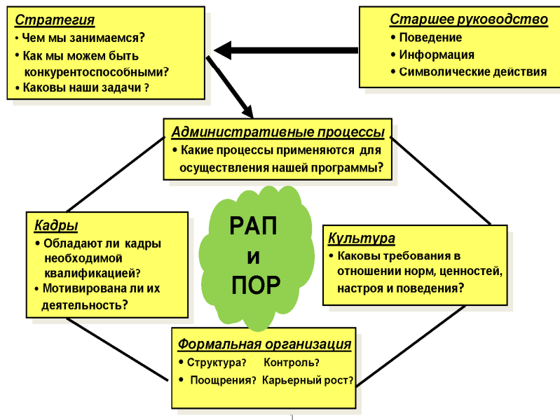
Диаграмма 1. Модель УПОО и ее связь с РАП и внедрением ПОР