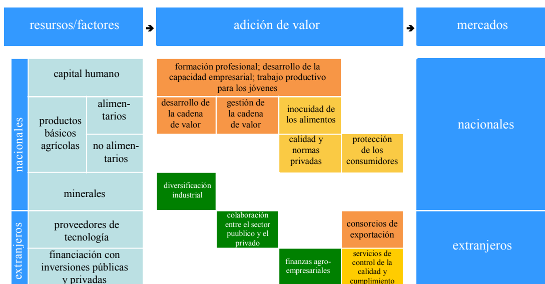
Gráfico: Servicios especializados de la ONUDI

2. En el gráfico que figura a continuación se muestran algunos de los servicios especializados de la ONUDI que apoyan a las pequeñas y medianas empresas (PYME) a lo largo de las cadenas de valor locales, regionales y mundiales. Lo que es más importante, a través de la representación gráfica de las relaciones existentes entre ellos se pone de relieve la naturaleza integrada de los servicios y se destaca el modo en que se combinan para ofrecer soluciones integrales en los países en desarrollo.